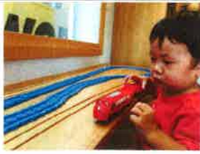
おおもてんミュージアムにて

ちえのわ不動産はライフスタイル提 型の不動産屋さん、設計事務所です。 私たちの考える理想の暮らしに「く でも共感していただける方、ぜひうちで 物件を探しませんか？」