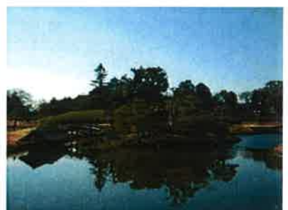
岡山後楽園 岡山城 (徒歩10~15分くらい) 散歩コースに名所旧跡があると、なんだか不思議 な感じがしてきます。四季折々のお庭を楽しんで ください。