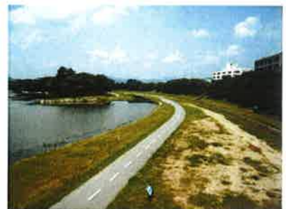
旭川・百間川ジョギングコース (徒歩2分) 河川敷のジョギングコース。春になると河川敷の 桜が一斉に咲き誇ります。