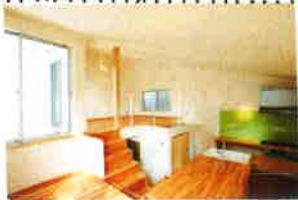
施工例 我が家です。

レバターの保守点検費用で管理費が徴収されますが「小橋町 の長屋」は共用部分が少ないので、駐車場1台込みで4000円 程度と想定しています。外壁は専有扱いになるので、修繕積立金 は徴収しない予定です。