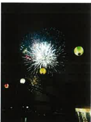
花火大会 8月第1土曜日 (徒歩1分) 夏の花火大会は、すぐ側で開催。 見上げて見る花火は迫力満点です。