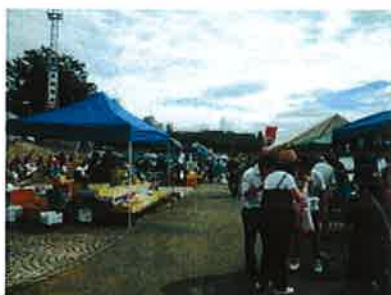
京橋朝市 毎月第1日曜日 (徒歩3分) 夜明けから始まる朝市には美味しいモノや珍しい ものがいっぱい。早起き頑張ってください。