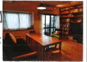
施行例：マッシュルームバージョン

→空間が引き締まっていいですよ。 ■フローリングには無垢材を使おう 一般的に使われる場合フローリングは、表面にウレタン塗装 が施されています。傷がつきにくく、隙間ができてくらくらしてよく使 われています。(しかし私たちがオススメするのは無垢材のフロ ーリングです。手触り足触りが断然気持ちいいです。夏はすべと 裸足で生活したくなりますよ。つぎに木が呼吸することで調湿 効果と得ることができ、夏は湿気を吸って膨らみ、冬は乾燥して木と木の間に 隙間ができるのがその証です。 樹種によって柔らかい木、硬い木、白い木 赤い木、茶色い木、いいにおいがする木な どありますので、用途に併せて選ぶのも 楽しいです。また張り方も、一般的な 張り方から市松模様にした、パーケット敷きにした、予算 が許せばいろいろとできます。 夢の家づくり！という内容では無いのですが、うちでよくお話しするこ とを羅列してみました。もっと詳しく！という方はご連絡ください。