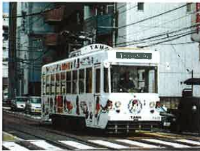
路面電車 小橋電停 (徒歩4分) 昼間は5分ごとに電車がやってきます。 岡山駅まで約10分。