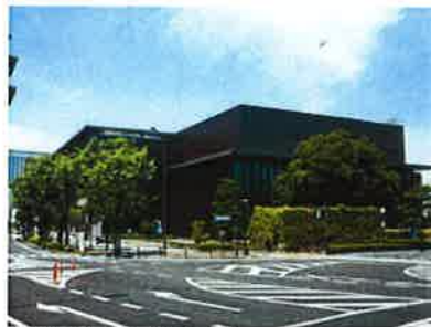
岡山県立図書館 (徒歩5分) 貸出冊数日本一に輝く便利な図書館。 本が好きな人は天国のような場所が徒歩圏内です。