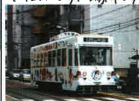
① 路面電車(徒歩4分) 岡山駅まで10分 昼間は5分ごとに電車来り