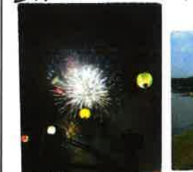
④ 花火大会 8月第1土曜日開催 徒歩10分の場所から 大きな花火が見られ