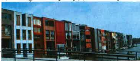
アムステルダム(オランダ)のコーポラティブハウス「小橋町の長屋」は2階建×4軒ですが、クワイエットなイメージにはなりません。

実は私も一人暮らしでコーポラティブハウスに参加して家を買った。元々今の家の近くに住んでいた私は「こんな街に近い場所で