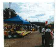
③ 京橋朝市 毎月第1日曜日(開催) おいしいものいっぱい並んでいます。