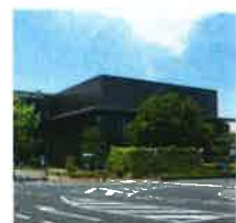
② 県立図書館 敷地から徒歩5分 とにかく便利な図書館!