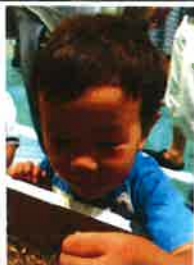
カブト出さわてて

ちえのわ不動産はライフスタイル提案型の不動産屋、設計事務所です。私たちの考える理想の暮らしに少しでも共感していただける方、ぜひうちで物件を探しませんか？