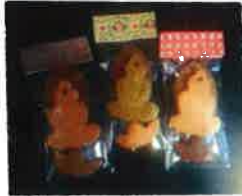
ほとけさまクッキー

番町にある長屋カフェ「ネイロ堂」で「ほとけさま祭り」を開催します。元々は、私たちが、「お客様と一緒に、何か面白いことができたい」と思って何人かで集まって頂いたのがきっかけでした。打ち合わせて出てきたキーワードは仏像。仏像は静かなブームのようで、「仏像ガール」なる女性が本を出版する時代。仏像めぐりの旅をしてあちらこちらの仏像のお顔にうっとりする女性も数多くいらっしゃるそうです。