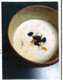
スジャータの乳粥

仏像になってみたい!という方は、2D仏像はカメラから顔を出してははいかかて(ようか、ニシユキマンが描かれる緻密な仏像は見てるだけでも楽しいです。ちよこさんが作られる3D仏像はとてユニーク。仏像になりかける仏像着ぐるみも他、ブーツをいたブーツ像、うそつぶの子作品を出版予定。どんなものが展示されるのかとても楽しみます。