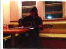
クリスマスライブの様子

不定期でご主人のブライヴも開催。はなはなライブで毎回楽しみにしている私たちです。他にも、似顔絵イベント・骨盤矯正体験などもおこなっています。ぜひブログやfacebookページでチェック