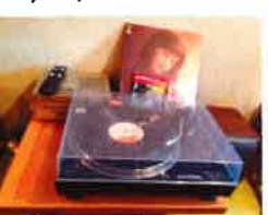
レコード試聴できます

表から見えるのは1階のスペースだけなので子ども向けのお店に見えてしまうのですが、河童堂さんの2階は大人向け。フォークソング好きのお主人が整理された古レコードが並んでいます。レコードはジャケットを見ているだけでもとても懐かしくて奥深いです。今はダウンロードするだけになってくれないかな。カバンタースや