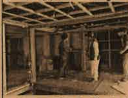
ほとんど解体できました

る!」とニコニコ笑顔で丁寧に解体されていきました。最初は慣れない作業に手こずっていましたが、終わりにには職人さん顔負けの解体ができるようになる人も、「家を壊すなんて滅多