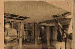
天井にゴソゴソと音

にできない作業だから気持ちよかった」と皆まんこにお話していました。6日はペンキ塗りです。まずは塗る予定の壁や柱を掃除していきます。何年もの空き家だったので、なかなか汚れが落ちません。ある程度