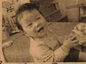
保育園に入園は1年

ちえのわ不動産はオーダーメイド型の不動産屋さんです。お客さまの探したい物件をお伺いして、個別に探していくというアナログな方法で物件探しを行っています。