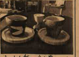
うっわも楽しい和室の2セ

ちえのわ不動産で今中(ト)長屋で喫茶店が3月にオープンしました。 場所：岡山市中区中納言町27日8-18 TEL: 086-234-8418 伊勢神社の裏にありますよ!! 4月の休み：2日, 10日, 17日, 24日 ぜひ行ってきて下さいね。