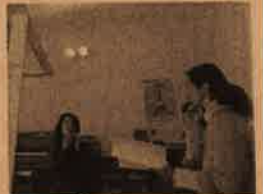
こんな感じでレッスン中です

時間: 10:30~11:30 駐車場が1台しかありません。できるだけ公共交通機関等でお越し下さい。お問い合わせ: ちえのわ不動産 086-206-2836