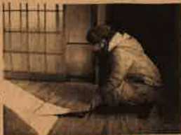
ユカハリタイルのNさま

岡山県北東部、西栗倉村(にしあわくらそん)の西栗倉・森の学校で製造されているユカハリタイル、タイルカーペットの要領で、部屋に敷くと簡単に無垢フローリングができてしまう画期的な商品。底はゴム地になっており、部屋を傷つけることが無い。ユカハリタイルのNさまめ、賃貸物件での用途に適しています。