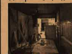
現在改装工事中です