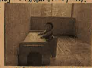
ユカハリ・タイルのショールームにて

先月の休日に鳥取県の県境にある西栗倉 森の学校に行ってきました。中納言町から車で約2時間の西栗倉村は別世界。私たちはお気に入りの大雨で外の景色を楽しむ余裕が全くありませんでしたが、天気が良ければたっぷり森林浴ができます。